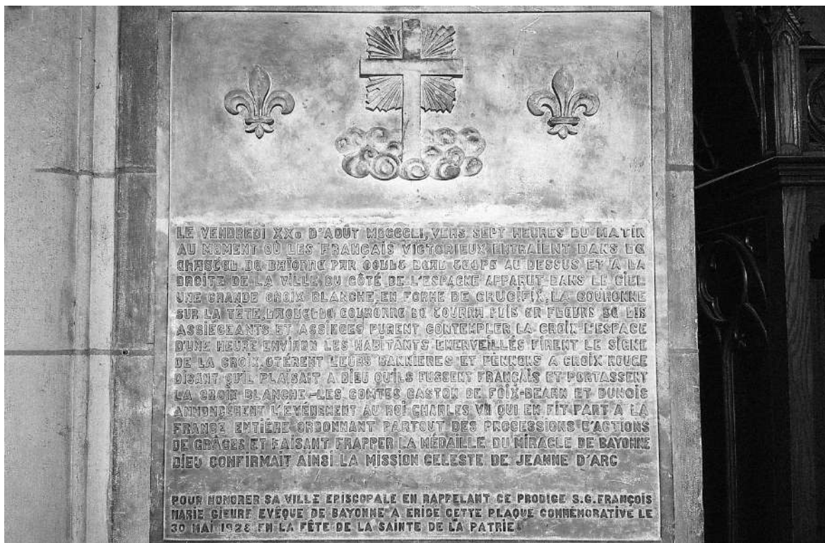
Placa del Milagro en la catedral de Baiona - año 1928

Recordemos ahora las circunstancias del milagro: que apareció en el cielo una cruz blanca (el blanco era el color del rey de Francia, pero por si acaso la "extranjera" Baiona no lo sabía además la corona de espinas se convirtió en flores de lis), lo cual hizo que sus habitantes se desprendieran para siempre de las cruces rojas inglesas y adoptaran inmediatamente el símbolo de sus conquistadores; veremos que el príncipe de Viana, cuyo máximo partidario –Johan de Beaumont– estaba también presente aquel día en Baiona, aunque curiosamente jamás hizo mención de que hubiera contemplado semejante prodigio celeste, y eso que vivió hasta 1487,