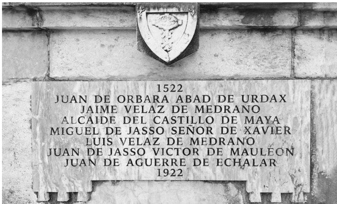
Castillo de Amaiur.

que visitó la corte de Olite en 1446), al menos hasta que, tentado por su suegro Juan II de Aragón, comenzó a intervenir en la política navarra y –traicionando a su antiguo camarada–, se convirtió en el enemigo más tenaz del príncipe, con ansia de alcanzar el trono de Navarra.