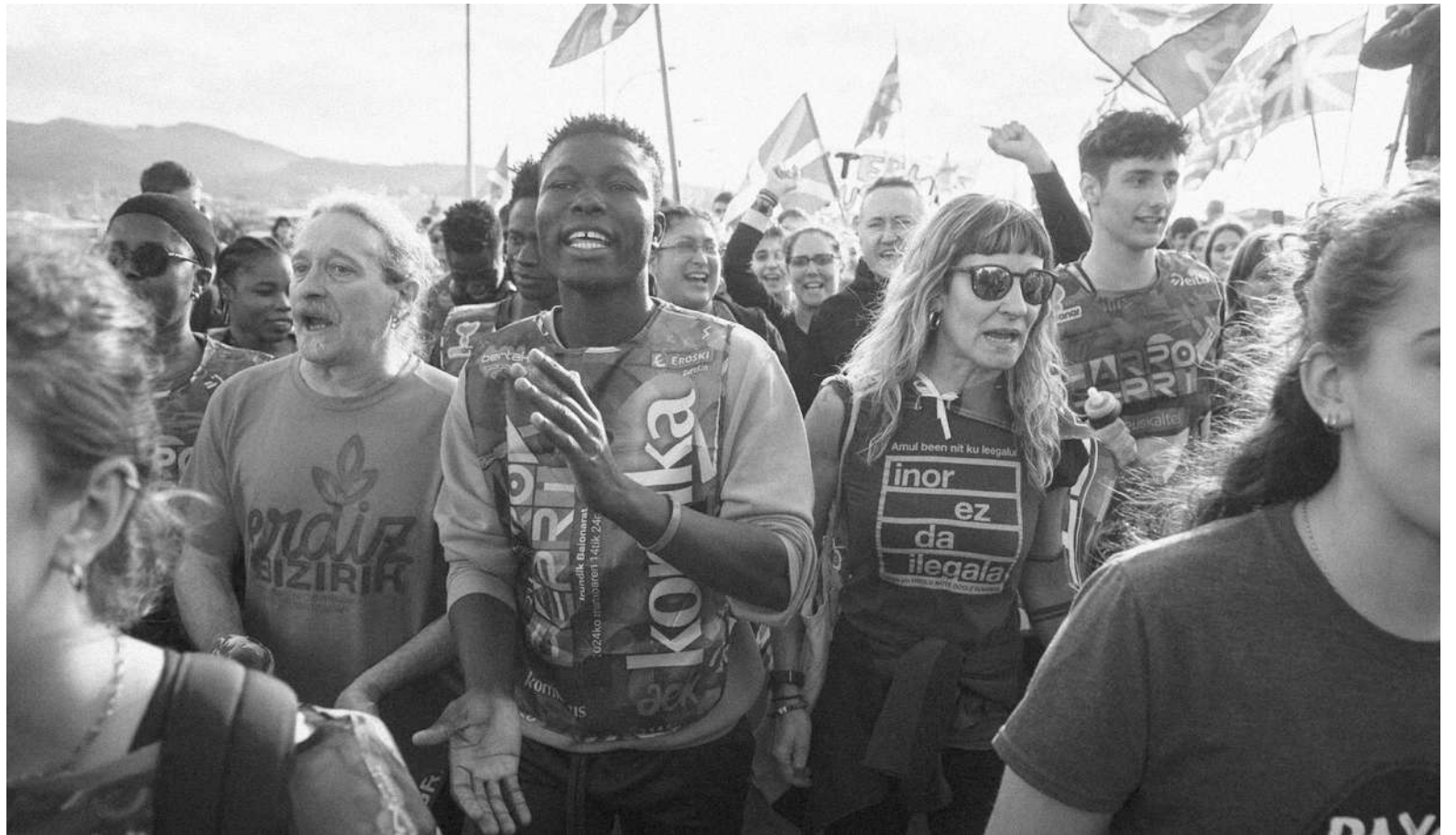
La korrika 24 al cruzar la frontera por el río Bidasoa

El año pasado Nabarralde or- ganizó en Oñati una jornada con el objetivo de reflexio- nar sobre la Globalización y sus efectos sobre nuestro país. En un mundo tan alborota- do y cambiante, tan acelerado y convulso como el que nos rodea, ¿qué posición ocupa nuestra nación? ¿Qué pre- siones o contradicciones nos impone? ¿Qué futuro se nos abre?