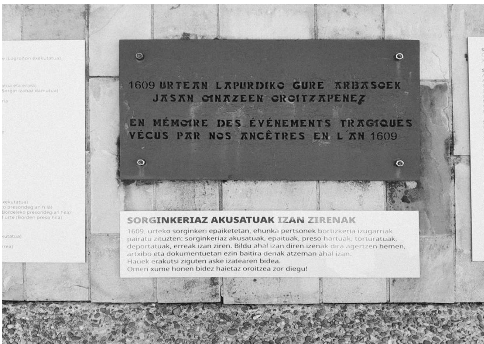
Sorgin ehizaren biktimak omentzeko plaka, Senperen. AIALA URTEAGATELLERIA