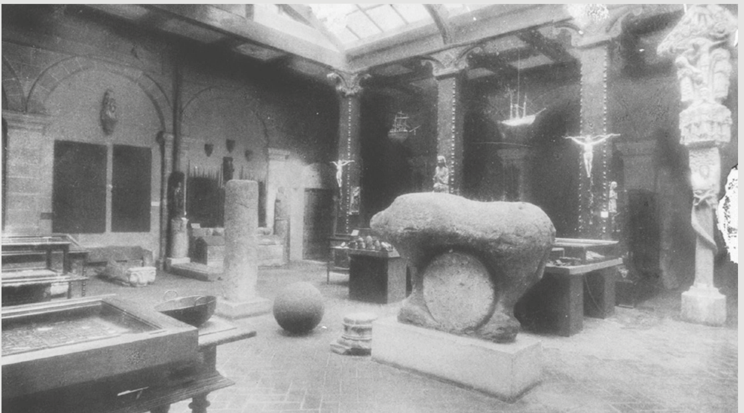
1. Foto sobre el año 1864 cuando fue recuperado 2. Claustro del Euskal Museoa de Bilbao con el Mikeldi