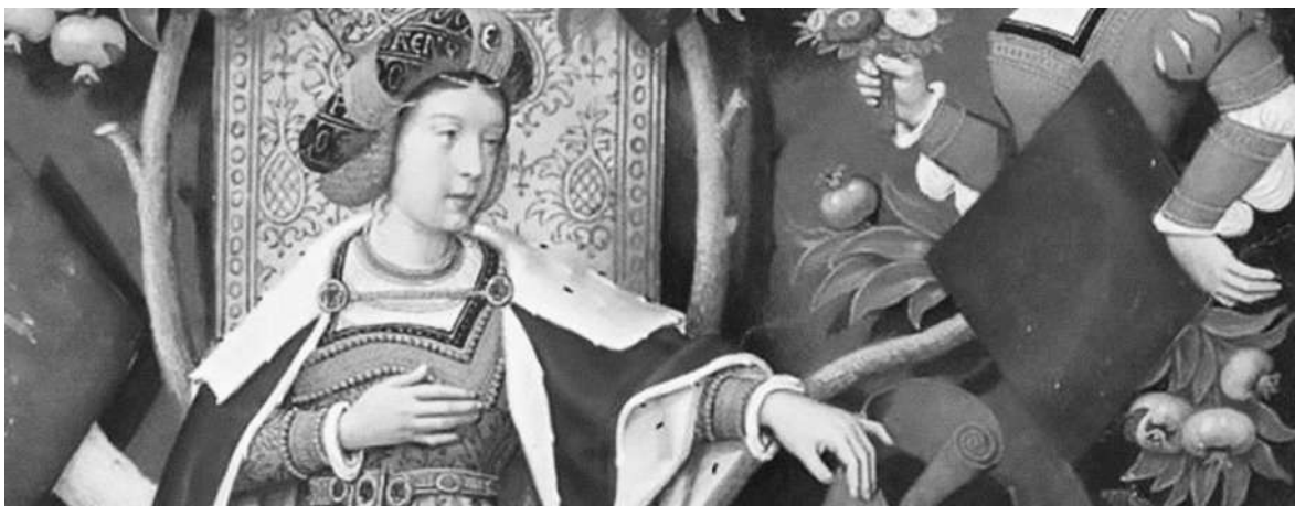
Retrato idealizado de la reina Toda que aparece en una genealogía de los soberanos de Portugal. (WIKIPEDIA)

AlHace 1.100 años fallecía al caerse de su caballo el soberano de Iruñea Sancho Garcés I, lo que propició que terminara de emerger la excepcional figura de su esposa, la reina Toda, que marcó la política de la Corona vascona durante décadas.