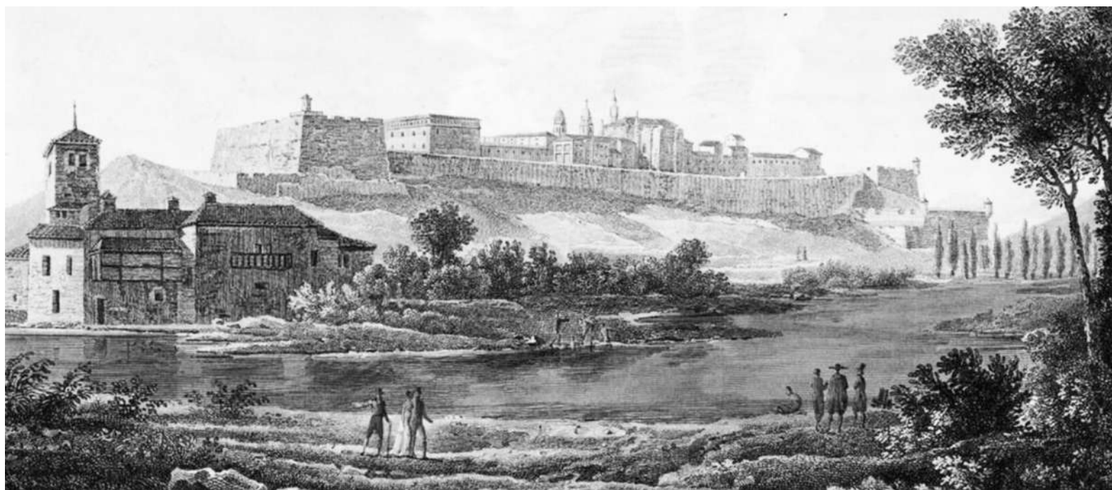
Pamplona hacia 1820 (litografía de Gossard).

Luchó contra los franceses a las órdenes de Espoz y Mina, y contra los carlistas de Zumalacárregui. Acaudilló a los amotinados que mataron al general Sarsfield, y fue fusilado por “querer proclamar la independencia de Navarra”