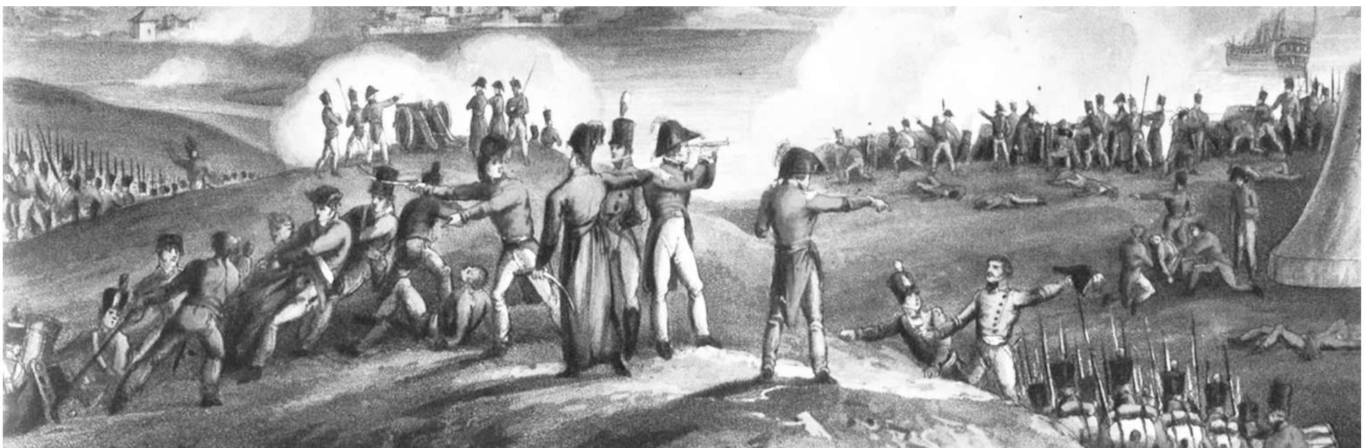
Cuadro parcial de “Asedio de San Sebastián”, Joseph John Jenkins