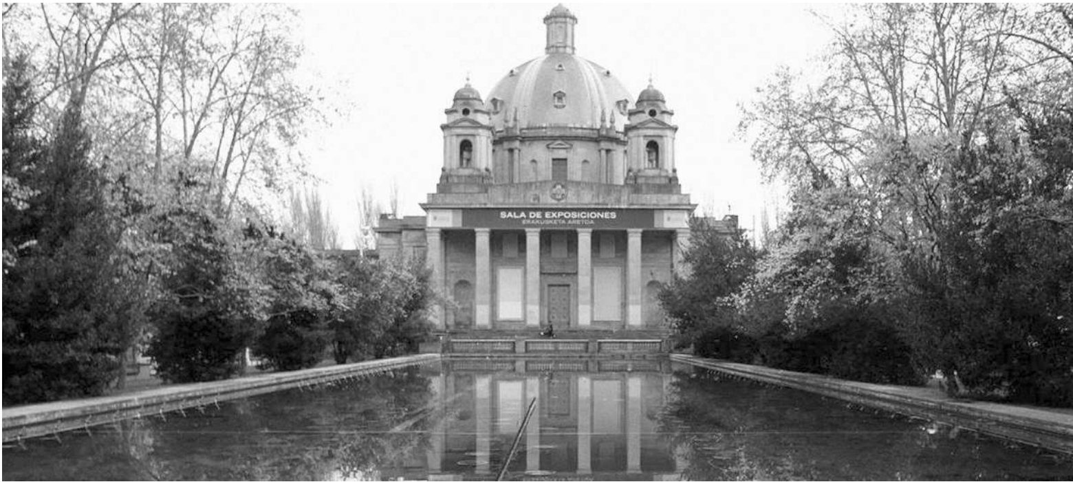
Monumento a los Caídos de Pamplona. Javier Bergasa

Hace dos años inaugurábamos en Luzaide, gracias a la voluntad popular que no a la voluntad de nuestros gobernantes, un monumento, obra del artista Patxi Aldunate, con el que llevábamos soñando desde hace muchos años: el monumento a la batalla de Orreaga. Una obra pensada para dar visibilidad a los vascones, una visibilidad que no tienen en el monumento que se levanta en Ibañeta. La escultura, para el que no la conozca, está compuesta por tres piezas con una simbología concreta: tres grupos de personas representando uno a las gentes del pueblo, otro a las del valle y un último a las gentes de Vasconia que acudieron a tomar parte en la batalla. La pieza habla también del posterior e inmediato nacimiento del reino de Pamplona, simbolizado por el niño que aparece iluminado bajo los rayos del sol. Sol-eki-eguzki, simbología que a su vez hace referencia a los cultos precristianos de los vascones, habla de la íntima conexión de nuestro pueblo con la naturaleza. Para quien no lo conozca, merece la pena acercarse al acogedor