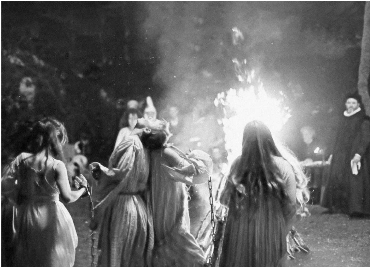
'Akelarre' filmeko irudia.

Aurreko hilabeteetako Kazetetan iragarri dizuegun bezala, aurten lehenetsiko dugun gaia duela 500 urte Nafarroako Erresuma konkistatu berrian antolatu zen lehenengo sorgin-ehiza orokorra (ofizialki, sorginkeriaren aurkako prozesu orokorra) izango da.