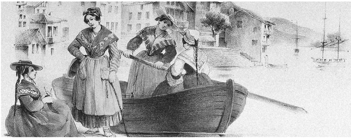
'Bateleras de Pasajes'. B. Hennebutte-Feillet Un reportaje de Felicitas A. Lorenzo Villamor

descansan inéditos muchos de sus escritos sobre el pueblo vasco.