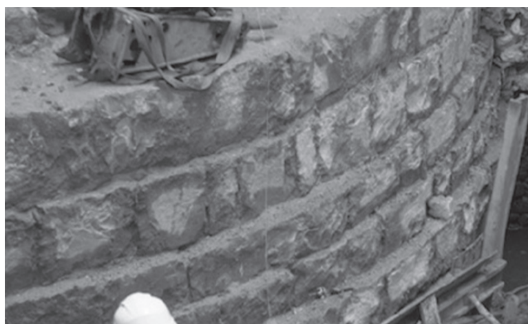
Restos de uno de los torreones del castillo de Luis el Hutín localizados en unas obras en Iruñea.

Un castillo que seguía modelos franceses, en cuya construcción se utilizaron materiales de la Navarrería arrasada treinta años antes, levantado en tan solo dos años y que contaba con tres puertas. Así era la fortaleza que el rey Luis el Hutín (el Obstinado o Testarudo) ordenó edificar en el siglo XIV en Iruñea para demostrar su poder y cuyos restos han aparecido en unas obras en la plaza que recuerda su existencia.